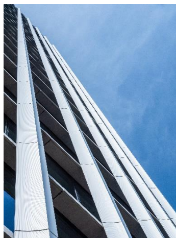
高層部の縦フィン