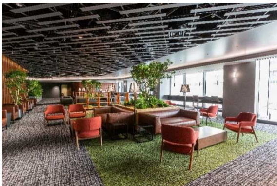
オフィスワーカー専用のサポートフロア「WELLCO」