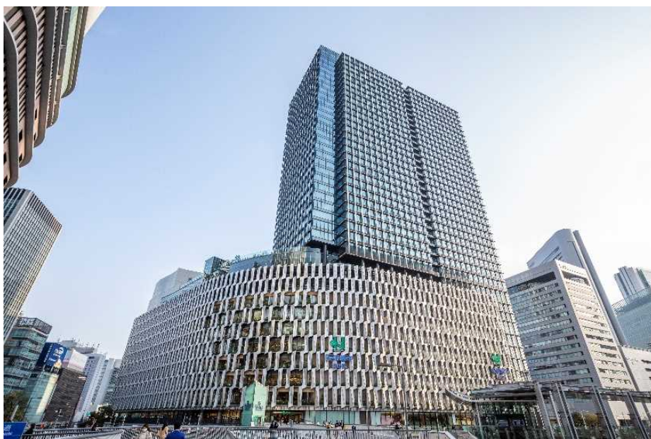
大阪梅田ツインタワーズ・サウス 外観