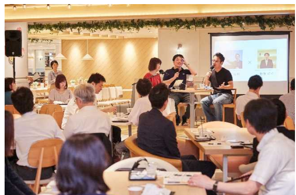
阪急阪神ワーカーズサービスのイベント (他のビルでの実施例)