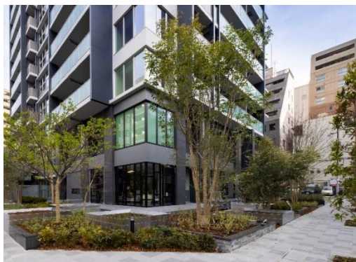
グリーンプロムナード

ジオタワー南森町は、梅田エリアから約 1.6 キロ圏内の都心にありながら、大川や大阪城公園などの緑豊かな自然を身近に感じられるエリアに位置しています。まず、周辺の街並みへの配慮として、4 周道路に位置した敷地を活かし、周辺をぐるりと歩道や街路樹、植栽帯で囲い「通り」に潤いと新たな景観を創出しました。環境への配慮としては、1 階共用部に wi-fi 環境を整備したブックラウンジを設置し、本を読むだけでなくテレワークスペースとしても常時開放することで通勤交通に伴う CO2 排出削減に貢献します。居室のすべての開口部において、空気層側に特殊金属膜（Low-E 膜）をコーティングしたガラス（Low-E 複層ガラス）を採用し、室内の高い断熱性能や遮熱性能を実現しました。また、省エネ性能の高い設備機器を標準設置するなどの取組みを行っています。