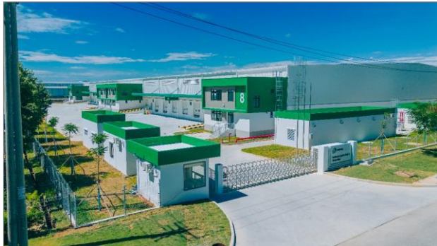
セムコープ ロジスティクスパーク (クアンガイ) 外観

今般、開発を進めてきたベトナム中部の VSIP クアンガイ工業団地と VSIP ゲアン工業団地内の物流倉庫「セムコープ ロジスティクスパーク (クアンガイ)」と「セムコープ ロジスティクスパーク (ゲアン)」（以下、「両物件」）が竣工しましたので、お知らせします。