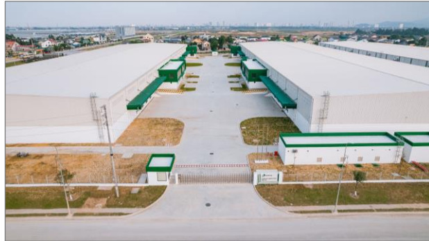
セムコープ ロジスティクスパーク (ゲアン) 外観

この竣工により、セムコープ インフラ サービス社を通じて運営する物流倉庫は、ベトナム北部の竣工済物件を合わせると、棟数は計 10 棟、総賃貸面積は約 13 万㎡（約 4 万坪）となっています。