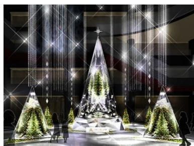
メインクリスマスツリー 「Infinity Wish Tree」イメージ

他にも、グランフロント大阪 ショップ&レストランのプレミアム賞品プレゼントキャンペーンなど、期間中に実施するさまざまなイベント等を通じて、進化し続けるうめきたエリアをさらに盛上げる、今年にふさわしい感動的なクリスマスをお届けします。