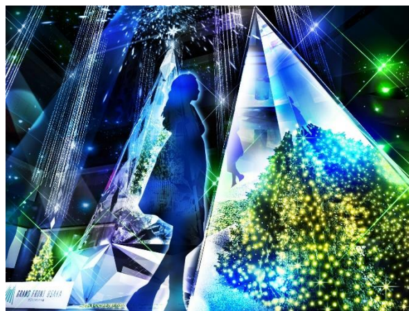
内部の色が変化し、表情を変える「Infinity Wish Tree」(イメージ)