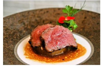
南館 8 階レストラン「チェサビーク」食事券 ※賞品はイメージです。