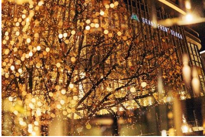
過去実施時の様子

なお、本イベントで使用する電力は、「RE100」※に対応した実質再生可能エネルギー由来となっており(一部エリア除く)、LED 電球も省電力のタイプを採用するなど、環境に配慮したイルミネーションを実現しています。