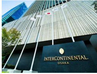
インターコンチネンタルホテル大阪宿泊券