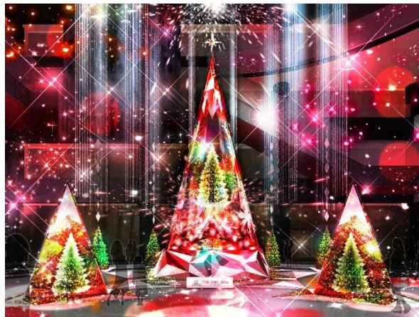
ライティングショー実施(イメージ)