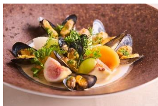
※写真はいずれもイメージ