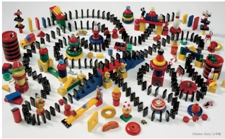
1巻:おもちゃばこ ドミノは うまく たおれるか