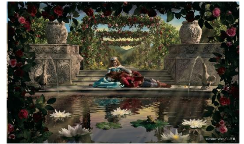
5巻:むかしむかし びじょとやじゅう