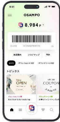
OSAMPO アプリ 画面イメージ