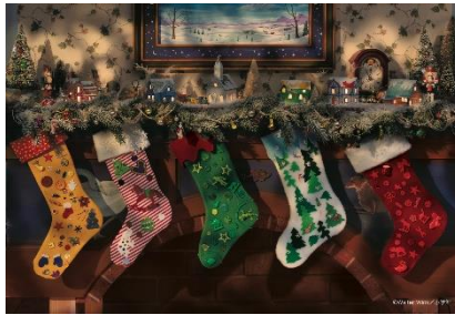
4巻:サンタクロース くつしたさげて まってます