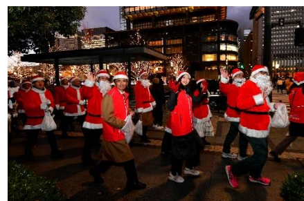
「Grand Santa Parade in UMEKITA」 イメージ