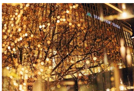
「Champagne Gold Illumination in UMEKITA」 過去実施時の様子