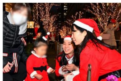
「Grand Santa Parade in UMEKITA」開催イメージ