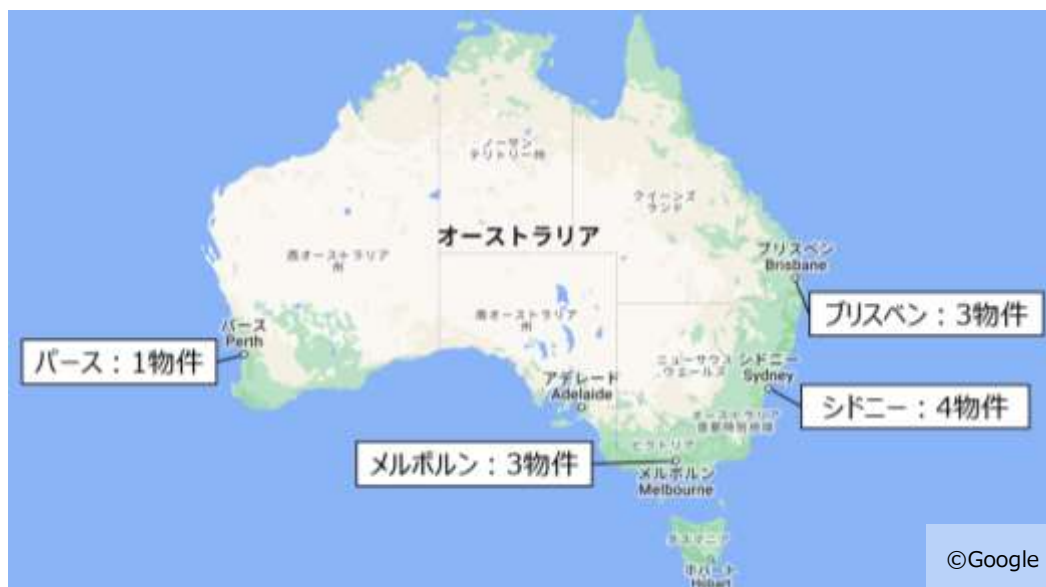
本物件の所在エリア

当社では、2023年にHHPAUSを設立し、シドニーの複合施設「60 Margaret」を取得することでオーストラリアへの事業進出を図っておりますが、今後も引き続きオーストラリアにおける不動産事業の拡大を進めてまいります。