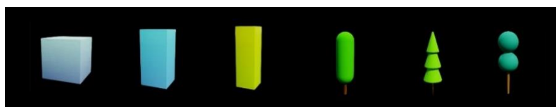
“まち”の一部として取り込まれた建物や樹木などのレギュラーアイテム(一例)

お客さまのアバターが現れ、さまざまな色や形に変化し、架空の“まち”に取り込まれます。