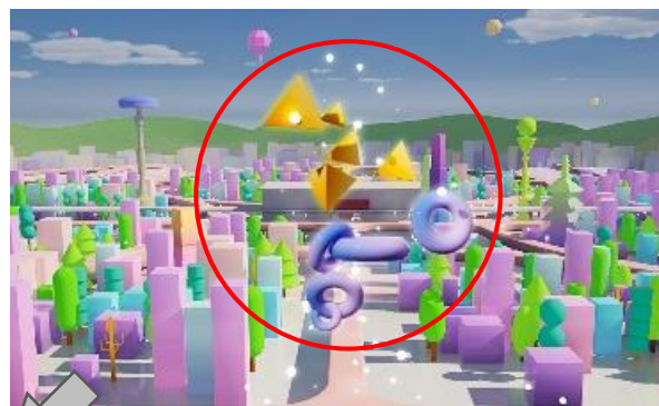
アバターが生成された様子

「阪急阪神 MEETS」のエントランス MEETS Square にある巨大 LED ビジョン前に立つと、アバターが生成され、さまざまな色や形に変化します。