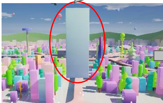
建物に変化した様子