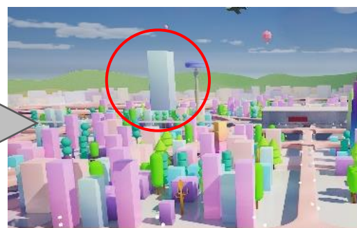
“まち”の一部として取り込まれた建物