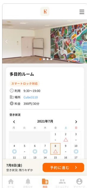
スマートフォン版 施設予約ページ

「彩都スマートシティコンソーシアム」（※1）では、彩都におけるスマートシティの実現に向けて、7月8日、株式会社フォーシーカンパニーが運営する「彩都スタイルクラブ」（※2）の会員向けポータルサイト「彩都NAVI」を、株式会社ビットキーが提供する「homehub」（※3）を利用して刷新しました。