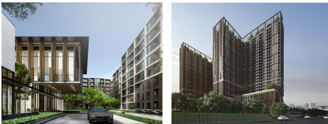
※『(仮称)Rama 9(ラマ ナイン)プロジェクト』、『(仮称)Chaeng Watthana(チェーン ワッタナ)プロジェクト』のイメージパース