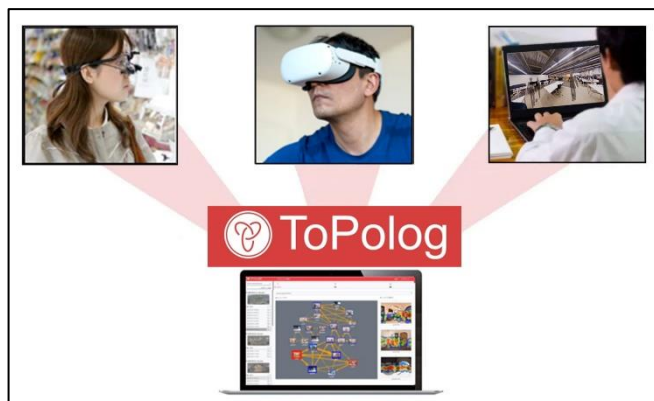
株式会社ジオクリエイツ サービス概要イメージ

最優秀賞を受賞した「株式会社ジオクリエイツ」はピッチテーマの一つである「顧客との接点のデジタル化とデジタルマーケティングの推進」、また、「株式会社冒険の森」はピッチテーマの一つである「安全でクリエイティブな都市生活、スマートでウェルネスなまちづくりの実現」に、それぞれ大きく寄与する可能性が評価されました。