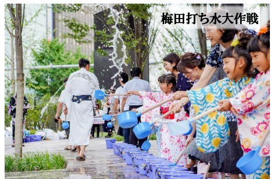
梅田打ち水大作戦

ゆかた姿で夏を満喫する！ゆかた祭を満喫する！写真をSNSで投稿頂いた方から抽選で素敵な賞品をプレゼント。