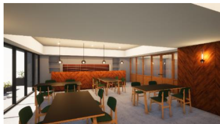
ダイニングラウンジ

※共用部の企画・デザイン監修(一部):成瀬・猪熊建築設計事務所 ※各イメージは現段階での想像図であり、実際とは異なる場合がございます。