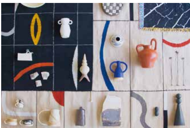
KJA studio / Mel Lumb Ceramics / rres / Sophie Alda / and more「Nature in Object」 会場：ハウス / バディオプティカル