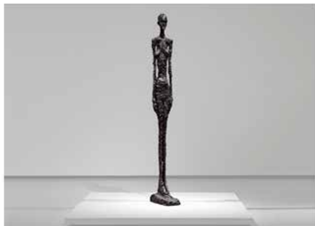
アルベルト・ジャコメッティ 「アルベルト・ジャコメッティ展」 会場：エスパス ルイ・ヴィトン大阪