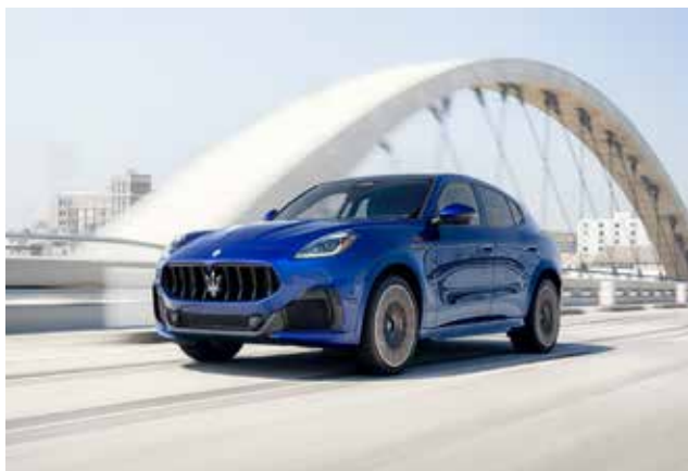
「新型SUV マセラティグレカレ」特別展示会