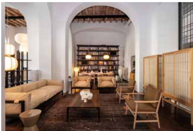
「TIME & STYLE POP UP」