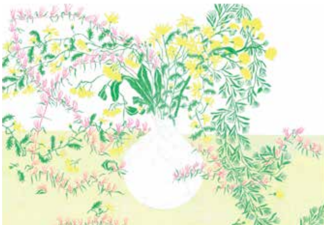
矢後 直規 「矢後直規展 新鳥獣図」 会場：graf porch