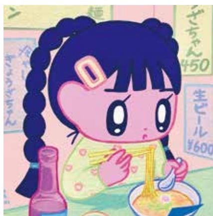
モニョチタポミチ個展「Days」 会場：チグニッタスペース