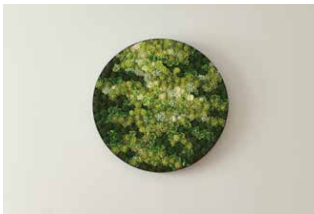
「Create from nature